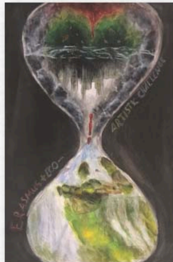
Εικαστικό έργο: Νικολάου Χαρίλια Α21