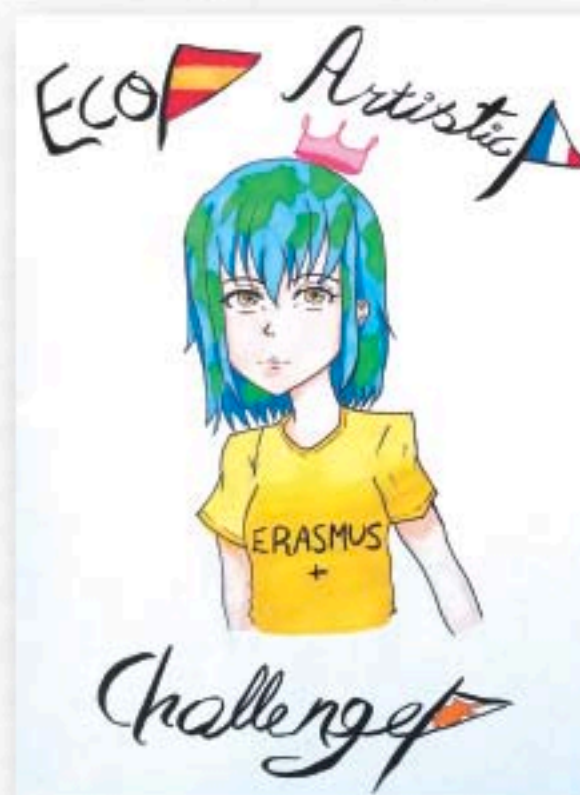
Εικαστικό έργο: Συλλούρη Φοίβη Α11