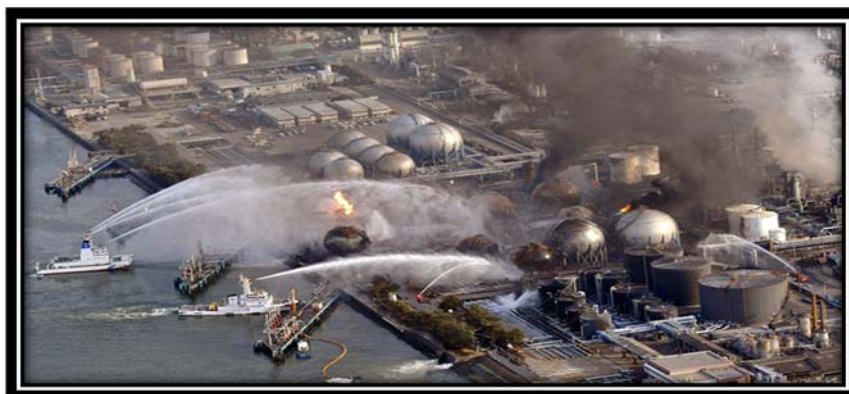
Πυρηνική κρίση, Ιαπωνία 2011